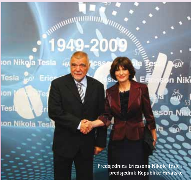
Predsjednica Ericssona Nikole Tesle i predsjednik Republike Hrvatske

Predsjednik Republike Hrvatske u prepoznatljivom je stilu naglasio značaj kompanije: „Ovdje smo vidjeli početak jedne manufakture u telefoniji, da bi došli do jedne sofisticirane proizvodnje, proizvodnje znanja. Izvozimo pamet, ali zadržavamo izvor te pameti. Kada bi takvih firmi bilo više, prije bi Hrvatska ostvarila svoj cilj, a to je da bude zemlja znanja. Zemlja znanja može biti samo ona koja ulaže u obrazovanje, koja ulaže u mlade i to je naš