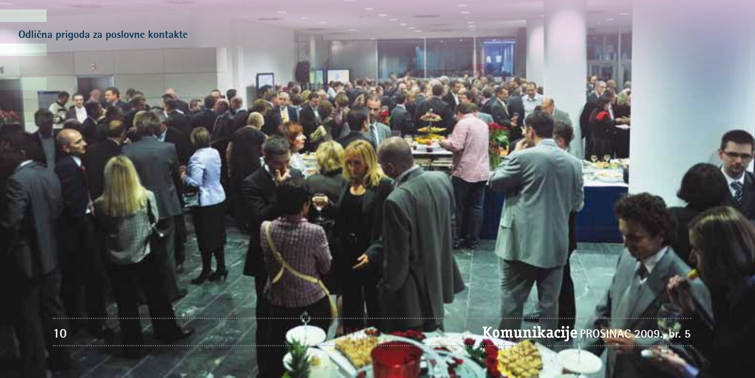
Odlična prigoda za poslovne kontakte

U nemogućnosti da i osobno bude prisutna na svečanosti, čestitke je uputila i predsjednica Vlade Republike Hrvatske, Jadranka Kosor. U svom obraćanju gospođa Kosor istaknula je kompanijski značaj u okvirima regije i korporacije Ericsson uz istovremenu društvenu i socijalnu odgovornost te kompaniji poželjela daljnje uspješno poslovanje.