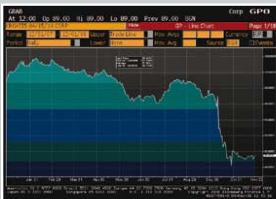
Graf 2. Prikaz kretanja cijene hrvatske euroobveznice (s dospijecem 2014.) u 2008. godini*