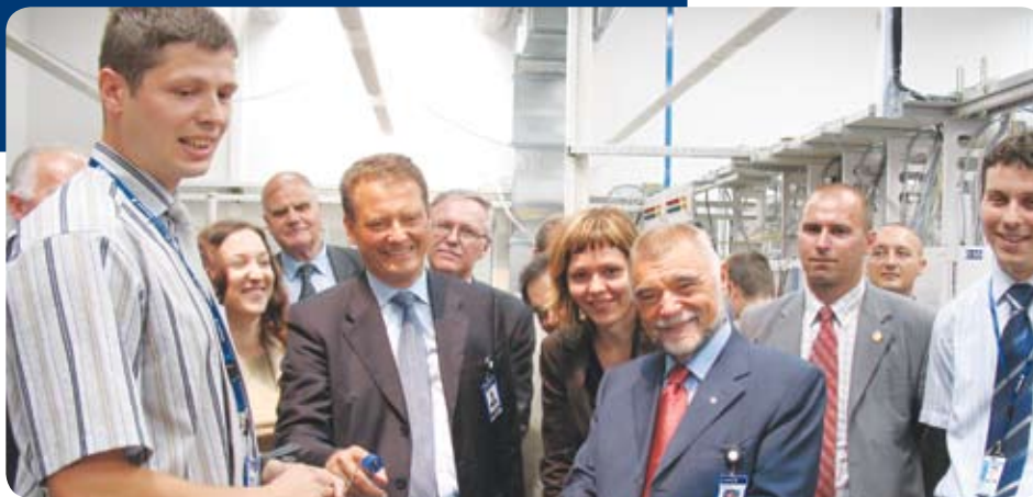
Prigodom prošlogodišnjega posjeta Hrvatskoj predsjednik i generalni direktor Ericssona Carl-Henric Svanberg pokazao je interes za rješenja u e-zdravstvu te je i sam isprobao neke funkcionalnosti, i to u društvu predsjednika RH Stjepana Mesića.

Podaci o pacijentu sabiru se iz raznih dijelova sustava u središnjem dijelu informacijskog sustava primarne zdravstvene zaštite pa je u svakom trenutku moguće gotovo trenutačno dobiti ažuran uvid u sva zbivanja koja određuju liječenje, koja se tiču zdravstvenog osiguranja i koja mogu upozoriti o mogućim bolestima. Posebnu brigu u kreiranju rješenja informatizacije zdravstva stručnjaci Ericssona Nikole Tesle posvetili su snažnoj i sveobuhvatnoj zaštiti podataka, očuvanju njihovog integriteta i tajnosti te privatnosti pacijenta.