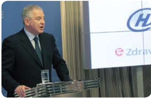
Predsjednik Vlade dr. sc. Ivo Sanader prigodom svečanoga puštanja u rad ISPZZ-a.