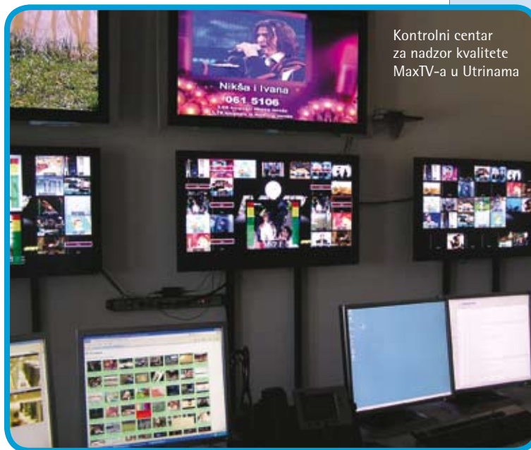
Kontrolni centar za nadzor kvalitete MaxTV-a u Utrinama

za nadzor kvalitete IPTV usluga, pri čemu smo unaprijed odradili veliki dio tehnoloških i organizacijskih priprema, javilo se više ponuđača. Nakon pažljive stručne analize procijenili smo da upravo Ericsson Nikola Tesla može odgovoriti na mnoge naše specifične zahtjeve kao operatora IPTV-a. Kako nam je bilo stalo da se posao što prije završi ETK je doista u kratkom roku osigurao isporuku opreme, a tvrtka AVC obavila je instalaciju, podešavanje i puštanje u rad. Početkom ove godine obavljena je integracija sustava i u