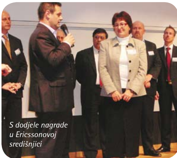
S dodjele nagrade u Ericssonovoj središnjici

„Predma se mnogo danas govori i očekuje od mobilne telefonije Ericsson je i dalje snažno pozicioniran kao isporučitelj fiksnih rješenja i usluga. Naša kompanija u tom je području izgradila veoma kvalitetne kompetencije, ima dugu tradiciju pa i ne čudi da su naši stručnjaci angažirani na mnogim poslovima korporativnoga značaja. Naravno, s ulaskom mobilne telefonije i mi smo počeli graditi znanja o mobilnim sustavima te smo se i tu pozicionirali kao kvalitetan i pouzdan partner. No, ostali smo jaki i u fiksnom segmentu, a kako pokazuje ova nagrada koja mi je nedavno dodijeljena Ericsson i to zna cijeni.”